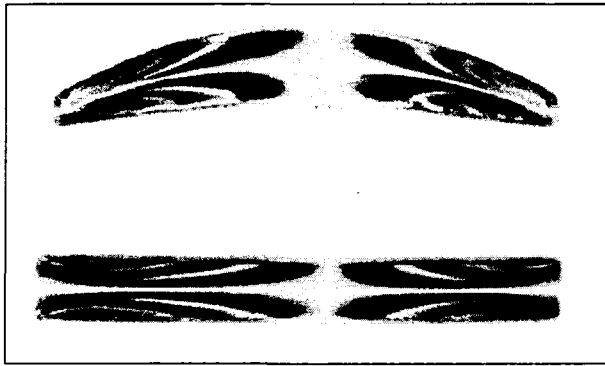
그림 2. 간섭색을 이용한 복굴절의 육안측정

본 장치에서는 회전 검광자법의 원리를 이용하여 평광상태를 측정하여 복굴절을 구하였다. 피측정 렌즈에 조사한 원편광은 피측정 렌즈의 복굴절에 의해 타원화 되어 1/4 파장판과 검광자를 통과하는 것에 의해서 피측정 렌즈의 복굴절 분포에 의한 명암 분포가 생기게 된다. 회전 검광자법의 원리에 근거해 검광자를 측정 광학계의 광축 주위에 회전시키면 회전에 수반해 명암 분포가 변조되고 CCD 카메라의 화소로 그 광 강도 변화를 검출하고 복굴절 위상차이와 주축 방위를 구한다. 편광의 회전 방향을 감지하면 -\lambda/4 \leq \delta \leq \lambda/4 의 range를 -\lambda/2 \leq \delta \leq \lambda/2 까지 확대할 수 있다. 그림 2는 기존의 간섭색을 이용하여 육안으로 측정한 복굴절을 보여주고 있고, 그림 3은 정량적으로 측정한 복굴절을 보여주고 있다.