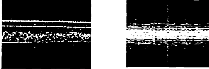
그림 2. Ti:sapphire 레이저 소스로 얻은 IR-Card 영상과 SLD 800nm 소스로 얻은 IR-Card 영상

아래의 영상은 Ti:sapphire 레이저로 IR Card를 SD-OCT로 얻은 이미지와 SLD 800nm 소스의 레이저로 IR Card를 SD-OCT로 얻은 이미지이다. 각각의 레이저 소스로 인한 이미지가 달리 보임을 알 수 있다. IR Card는 같은 것을 사용하였지만 레이저소스와 스펙트로미터를 달리하여 얻은 이미지인데 이 두 영상을 같은 영역에 대하여 matching을 시켜 보려고 하였다. 이는 후에 같은 위치의 영상을 정합 할 수 토대를 마련하여 우리가 원하고자 하는 부위를 3차원 영상으로 얻고자 하는데 그 의의가 있다.