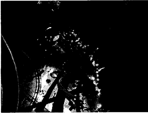
▶▶ 그림 3. 놀이기구 체험 화면