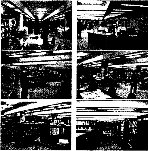
<그림 1> 기존 자료실의 모습

그러나, 차츰 자료의 디지털화 및 이용자의 행태변화로 물리적공간에 대한 이용율이 계속 감소추세를 보이고 있다. 따라서 현재의 상황 및 앞으로의 나아갈 방향을 설정, 재구성이 필요하였다. 단순히 자료 열람 및 보관 공간에서 탈피하여 최대한 이용자들이 활용할 수 있는 학습 및 커뮤니케이션 공간으로 재구축하고자 하였다. 이는 nonlibrary service 라고 전통적으로 여겨왔던 기능으로 너무 학술적인 면에 치중해서 이용해 오던 이용자들을 위한 자료실의 기능을 좀더 인간적이고, 더 나아진 면들로 끌어들이고자 함이다. 이용자들은 업무 외에도 자료실에서 사람들과 만나 사교적인 활동으로 좀더 가치있는 시간을 보내고 싶어하는 경향이 있다. 따라서 이용자가 요구하는 자료를 찾으면 그것을 대출하여 바로 돌아가 버리는 것이 아니라, 장시간 자료실에 머물며 여러 가지 서비스를 받을 수 있도록 각각의 공간적 기능들을 세련되게 구성하여 합리적이고 효율적인 체재형 공간을 구성하고자 한다.