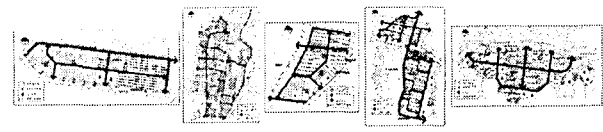
그림 1. 사례대상지