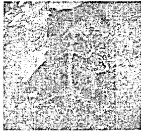
중국 닝시아 자치구 허란 산의 수족과장형의 인상