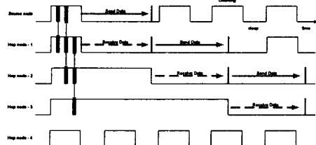
그림 1. 변형된 listen / sleep 기법

Idle Listening 구간에서 발생하는 에너지 소비를 줄이기 위해, Listen과 sleep상태를 주기적으로 반복하여 센서 노드에서 소비되는 전력을 줄일 수 있지만, 데이터 전송 시점에서 송, 수신 센서 노드의 상태가 sleep이면 즉시 데이터 전송을 하지 못하고, 전송 가능한 상태로 변경될 때까지 전송이 지연된다[5]. 센서 노드의 수가 많은 센서 네트워크 환경에서 데이터 전송은 다수의 센서 노드를 거쳐서 전달되기 때문에 전송 지연시간이 누적되어 발생하게 된다.