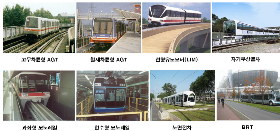
그림 1. 주요 경전철 시스템

경전철은 “대량수송 및 정시성 등의 기존 대중교통수단을 만족하면서 버스와 중전철(지하철)의 중간 규모(5,000~30,000명/방향/시간)의 수송능력을 가지고, 완전무인 자동운전이 가능한 첨단 궤도교통시스템”으로 정의될 수 있다. 현재 세계적으로 운행되고 있는 경전철은 시스템 제작사별로 상이한 특성을 가지고 있기 때문에 체계적인 분류가 어려운 상태이다. 분류방법에 따라 다소 차이가 있지만 차량의 구동원리 및 운행방법에 따라 고무차륜 AGT(Automated Guideway Transit), 철제차륜 AGT, LIM(Linear Induction Motor) AGT, 모노레일, 노면전차, 자기부상열차, BRT(Bus Rapid Transit), PRT(Personal Rapid Transit) 등으로 분류할 수 있다.