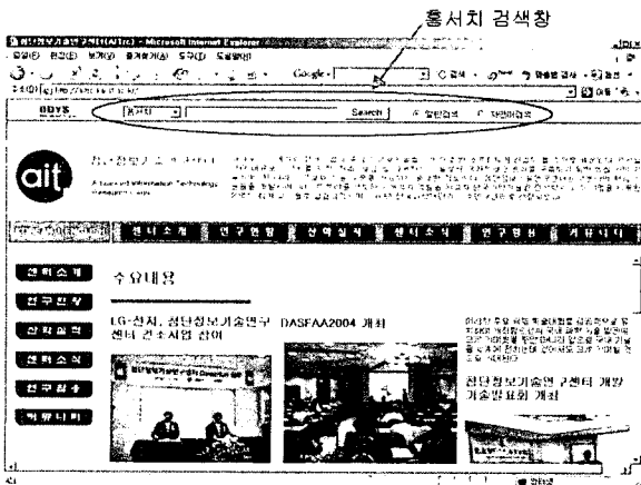
그림 6. 홈서치 화면.

그림 6은 오디세우스 객체관계형 DBMS를 사용하여 구현한 홈서치 기능을 제공하는 웹 사이트에 접속한 화면이다. 화면에서 페이지 프레임이 위, 아래로 분리되어, 위 프레임에는 키워드 홈서치 검색창