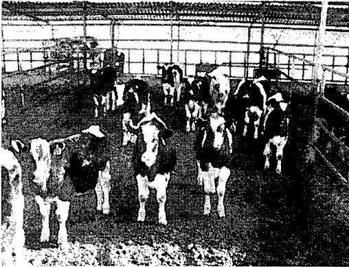
<홀스타인종 분유 떼기 송아지>