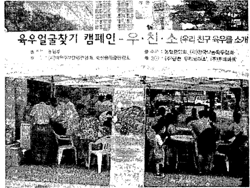
이마트 성수점에서 개최된 육우데이 선포식 롯데마트 영등포점에서 개최된 육우얼굴찾기 캠페인