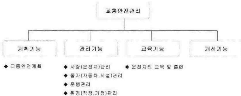
[그림 1] 운수업체 교통안전관리의 기본구조

운수업체의 안전관리를 위해 매년 운수업체 교통안전진단을 실시하여 운수업체의 운전자관리, 자동차관리, 회사경영 실태 등을 분석하여 종합적인 안목에서 대책을 모색하고 있다. 교통안전관리의 주된 목표는 교통사고를 방지하는데 있으며, 교통사고의 예방은 사고의 원인을 찾아 미연에 제거함으로써 사고방지의 큰 효과를 거둘 수 있다. 이러한 교통안전관리의 기본 구조는 다음과 같다 3) .