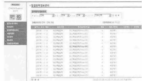
[그림 3] 점검항목 변수 관리 화면

각 항목정보를 관리하는 화면을 나타내었다. 각 발전소 호기 계열별로 성능감시 모듈의 점검항목 정보를 등록 관리 할 수 있다.