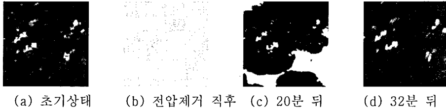
그림 3. 픽셀 외부에 twist domain을 형성하지 않은 BCSN 셀의 특성