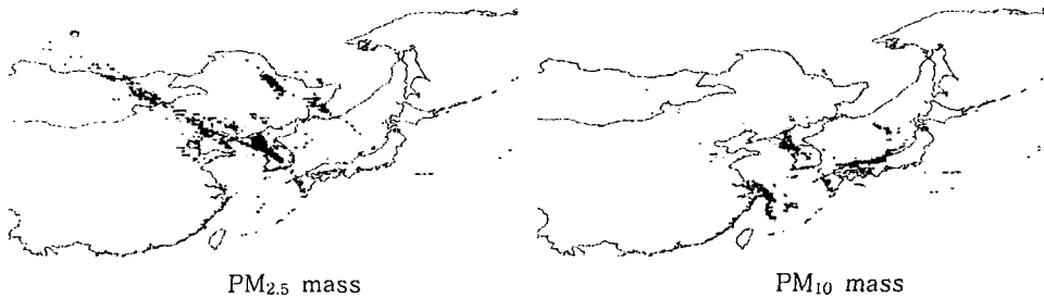
Fig. 1. PSCF results of PM 2.5 /PM 10 mass concentration at Geoje island.

배경농도 측정은 서해안 강화, 태안 동해안 고성, 남해안 거제, 제주도 고산의 5곳에서 측정되었으며, 측정기간은 2000년부터 매년 30일~45일 정도 측정해오고 있다. 본 연구에서는 각 측정소별로 2001년부터 2003년까지 총 100 set의 측정자료에 대해 PSCF 모형에 적용하였으며, 적용된 측정자료 및 PSCF 결과를 그림 1과 그림 2에 나타내었다.