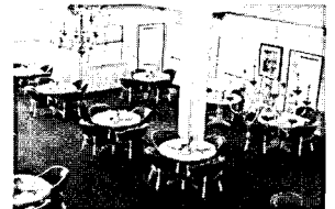
<사진 2> Bay Park의 공동식당

첫째, 노인주거유형은 독립주택이 가장 일반적인 유형이고, 공동생활주택과 생활지원주택과 같이 복합적으로 구성되는 경우가 많다. 둘째, 재정적 지원으로 거주인들은 SSI의 지원을 받고 거주시설은 HA, HUD에서 지원을 받고 있다. 셋째, 단위주호 유형은 스튜디오형과 1침실형이 가장 일반적인 형태임을 알 수 있다. 넷째, 시설에서는 식사 제공, 가사도움, 교통편의 애완동물 허용 서비스를 제공하고 있다. 이상의 콘트라코스타 카운티의 노인시설의 정량적 현황을 파악한 결과 본 연구는 미국인들에게 가장 보편적인 주거유형과 재정적 보조의 현황 그리고 그들이 선호하는 서비스의 공급 형태를 파악할 수 있는 정량적 기초자료를 마련하였다는 그 의의를 갖는다.