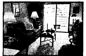
<사진 1> Kensington Place의 단위주호 거실