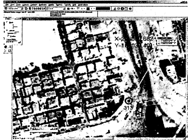
그림 4. 영상에 313좌표