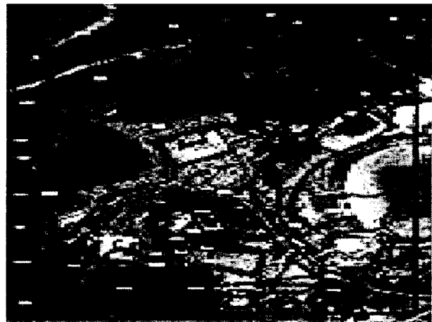
그림 5. 중첩된 모습