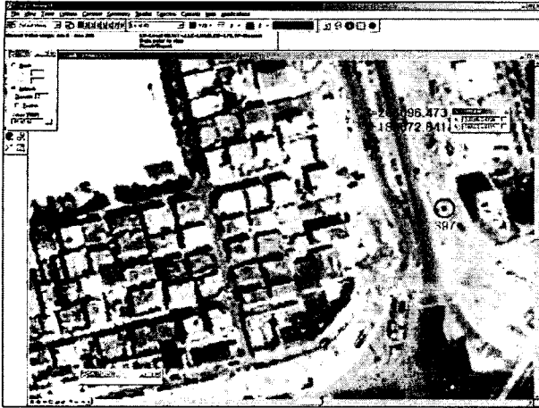
그림 3. 영상에 397좌표