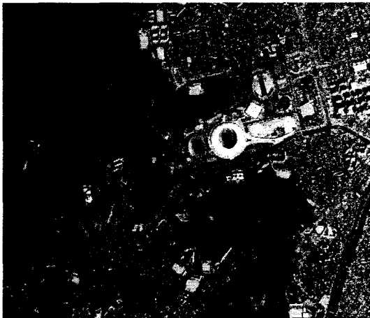
그림 2. 관측대상지역

본 연구대상지역 그림2와 같이 부산 월드컵 경기장 일대로 사직동 일부지역을 선정하였으며, 사용된 위성영상 자료는 기하보정 된 2001년 04월 23일 수집된 IKONOS 위성영상 자료를 이용하였다. 그림3은 알고자 하는 지적경계복원 측량도의 모습이다.