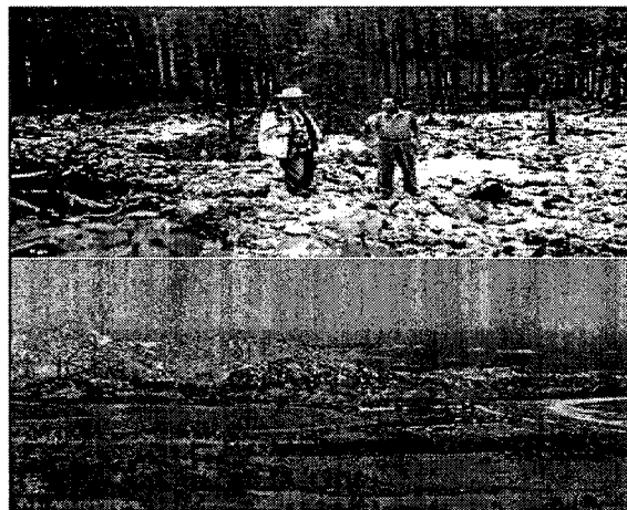
‘이끼(蘚)의 길’에 있었던 것으로 추정되는 대흥안령 북부 홀룬부이르맹 根河市 阿龍산의 이끼떼 (위 사진). 아래는 시베리아 순록유목민이 한반도로 이동해 처음으로 정착한 땅으로 알려진 지역. 강원도 고성군 민통선 안에 있는 감호(鑑湖)다.

순록의 먹이인 이끼는 생태상 습기가 많은 웅달에서 잘 자란다. 따라서 서(西)시베리아인은 이끼(蘚)가 더 잘 자라나는 새로운 목초지인 선(鮮)을 찾아 알타이·사얀 산맥 지대에서 태평양(해가 뜨는 동쪽·朝) 쪽으로 이동한 것으로 추정된다.