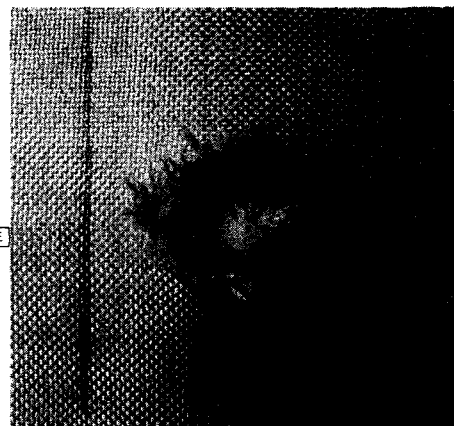
Fig. 1 Schematics of the ballistic range setup for hi Fig. 2 fiber composites materials after high velocity impact test