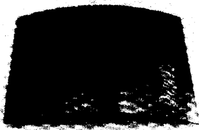
Fig. 1 Specimen with curvature

최근 신소재인 선진 복합 재료중 탄소 섬유 강화 플라스틱(이하 CFRP라고 한다.)은 비강도, 비강성이 높기 때문에 경량화가 요구되는 여러 분야, 즉 항공기, 인공위성, 원자로, 자동차 산업분야, 조선 산업분야 등 널리 사용되고 있다. 경량화가 요구되는 분야에 사용되는 구조 부재의 형상은 평판 보다는 다양한 형태의 곡면 형상을 띠는 셸(Shell)의 형상을 갖는다. 또한 이러한 구조물에 충격이 가해졌을 때 곡면을 갖는 구조물의 충격 응답 및 파괴형태는 평판과는 다른 양상을 보인다. 이런 현상을 관찰하기 위해 본 연구에서는 의 적층구성 및 곡률반경을 변화 시킨 CFRP 적층 Shell에 에어건을 사용하여 관통실험을 행하고 각 시험편에 대한 에너지 흡수 특성을 고찰하였다. 본 연구에 사용된 CFRP는 한국 화이바(주)의 CUI25NS이며 일방향을 가진 prepreg 이다. 시험편 적층 방법은 총 8ply [0/90 4 /0 2 ], [0/90 2 /0 2 /90 2 /0]로서 2계면 구조와 4계면 구조로 적층하였다. 시험편의 곡률 반경은 항공기 날개와 같은 일정한 곡률 반경 (R=∞, R=200, R=150, R=100)을 적용하였다. 시험편을 적층순서에 맞게 적층한 후 오토클레이브 성형기에 넣고 경화온도 130℃ 온도에서 약 90분간 경화 하였다. 제작된 시험편은 잔류응력이 발생되지 않게 다이아몬드 휠을 부착한 자동 정밀 절단기 (MICRACUT Precision Cutter)를 이용하여 100 ■ 140 크기로 절단 하였다. 실험 장치는 압축공기를 이용한 steel ball 발사 장치로, 압력 게이지 3, 4, 5, 6, 7 bar를 적용하여 지그에 고정된 시험편을 관통 시켰다. 시험편 관통 시 강구의 속도 측정에는 Ballistic - Screen sensor 로 측정하고 시험편 관통 전 속도와 관통 후 속도를 측정하였으며 충격에너지 흡수 능력을 평가하였다.