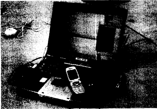
그림2. 휴대폰 테스트

이러한 Intrusive 방법은 보다 높은 자동화율과 Test coverage를 확보하는데 큰 도움이 되었다.