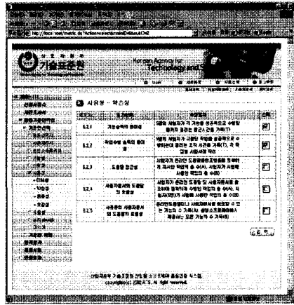
(그림 3) 실행화면

여 ActionForward 객체를 반환하게 된다. 위와 같은 작업을 통하여 실제 구현된 시스템의 모습은 다음 (그림 3)에 나타나 있으며 (그림 3)의 화면은 신청 제품에 대한 품질 측정 항목을 선택하는 작업을 나타내고 있다.