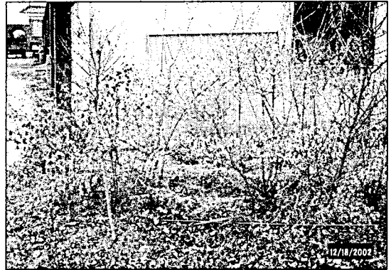
Figure 1. Comparison of New Yellow Fruit Cultivar of Ligustrum obtusifolium