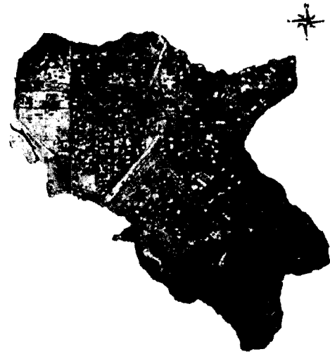
Fig. 2. distribution chart of open space in remote sensing analysis.

■ Park School ■ Street tree ■ water line