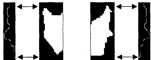
(a) 좌측 템플릿 매칭

을 제안하였다. 측면 얼굴은 보통 좌측 얼굴 또는 우측 얼굴임에 틀림없다. 피부색에 의해 후보 영역이 추출되면, 영역의 가로와 세로의 비율로서 세로 방향으로 1/2로 분할한다. 그러면 분할된 영역에서 좌측 영역은 좌측 템플릿과 비교하고 우측 영역은 우측 템플릿과 비교한다. 유사도가 큰 템플릿이 얼굴의 방향으로 결정된다. 따라서 그림 5와 같이 단지 좌/우측 템플릿 2번의 유사도 비교만으로 결정된다.