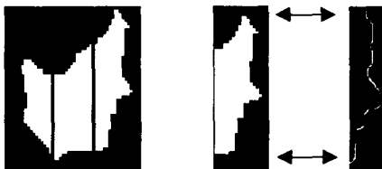
(b) 좌측으로부터 영역 분할 (c) 최종 후보 영역 매칭