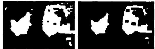
(a) Opening (b) Closing

음 성분이 많이 존재한다. 따라서 작고 고립된 영역은 얼굴 후보 영역에서 제외시킬 필요가 있다. 제거 과정은 템플릿 매칭 이전에 수행되어야 연산에 대한 오버헤드가 줄어들게 된다. 따라서 형태학적 연산을 사용하는 데, 후보영역과 약한 연결고리뿐만 아니라 약한 돌출 부위를 제거하기 위해 Open과 Closing 연산을 한다. 3×3 마스크로서 처리하여 잡음을 제거한 영상이 그림 2에 보여준다.