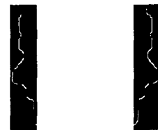
(a) 좌측 (b) 우측

최종적으로 얻어진 후보 영역에 대해서 템플릿 매칭을 하기 위해 2개의 템플릿이 그림 3과 같이 좌측과 우측으로 구성된다. 하나의 영역이 템플릿의 하나와 유사한 에지 곡선을 포함한다면, 그 때 그 영역은 측면 얼굴 후보로서 고려되어진다. 많은 요인들 때문에 얼굴의 윤곽은 여러 개의 에지 성분들로 분해되어지고, 템플릿에 닮은 단일 에지 성분은 없다. 따라서 이런 에지 성분들을 모두 고려하는 것은 의미가 없다. 따라서 식 (1)의 hausdorff distance인 H(A, B) 가 임계값 이상의 유사성을 가질 경우 후보 영역으로 결정한다.