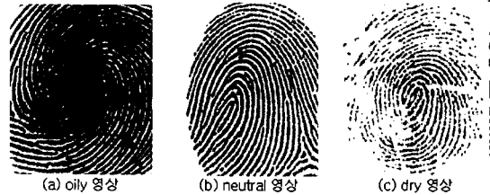
그림 1. 지문영상의 예

본 논문에서 제안하는 시스템은 그림 2와 같다. 입력장치로부터 획득한 지문영상의 품질평가를 위해 다양한 특징을 추출하여 클러스터링 방법을 통해 유사한 특징을 가진 영상끼리 모으고, 이 결과를 바탕으로 각 클러스터가 어떠한 특징분포를 이루고 있는지 분석한다. 품질분석이 완료되면, 그에 적합한 전처리 모듈을 적용한다.