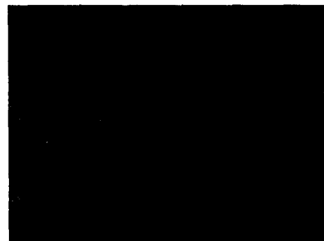
Fig. 2 The meshed shape of simplified pressure sensor