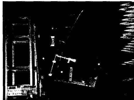
Fig.2 3D precision measurement for range alignment of CBS Ku-band antenna