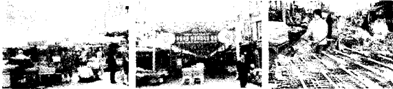
<사진4-5-6> 망우동 우림시장 정비 전/후, 내부 시장 정비

앞서 언급한 <사라가> 시장과 <우림> 시장의 사례를 분석해 보면 크게 형태적 접근과 행정적 접근, 이 두 가지 유형으로 변화를 시도한 것임을 알 수 있다.