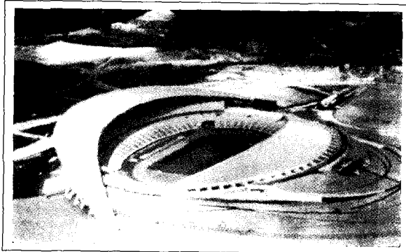
(그림1-3) 일본 경기장의 예

일본 경기장 외관에 대하여 양국인은, 한국 경기장과는 다르게 전체적으로 거의 일치된 인지적 반응을 볼 수 있다. 그 가운데 (그림1-2-B)의 b1로 표시된 바와 같이 단조로운, 기계적인, 기하학적인, 동근, 정적인, 날카로운, 안정적인, 화려한, 개성적인, 도시적인, 현대적인, 독특한 등의 평가척도 쪽에 근접된 동일한 인지적 반응을 보이고 있었다. 이러한 결과는 대다수의 일본 경기장이 간결한 구조와 많은 의미를 함축시킨 추상적 형태를 지향함으로써 양국인 모두에게 객관적인 인지적 반응을 얻었다고 볼 수 있으며 사실적인 표현으로 인해 다소 많은 선을 외부에 노출한 한국 경기장에 비해 형태를 단순화시킨 일본 경기장이 현대적이고 미래 지향적인 디자인으로 인지 되었다고 추측된다(그림1-3).