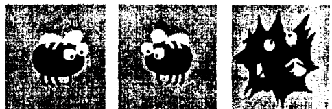
(a) 날아다니 (b) 정지상태 (c) 잡힌동작

본 논문에서 사용한 캐릭터는 [그림 2]와 같다. 캐릭터의 동작은 1) 날아다니는 동작 2) 정지상태의 동작 3) 배우에 의하여 잡힌 동작의 세부분으로 구성된다. 배우가 스크린상에 나타나기 전까지 캐릭터는 랜덤한 형태로 날아다니는 동작과 정지상태의 동작을 반복한다. 배우가 스크린상에 나타나면 캐릭터는 배우의 위치와 반대 방향으로 이동하며 배우의 채집기에 의하여 잡힐 경우 불잡힌 동작을 생성한다.