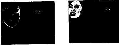
그림 9 부분 템플릿에 의한 눈 검출

입술색상으로 검출한 입 영역과 부분 템플릿으로 검출한 눈 영역을 그림9에 나타냈다.