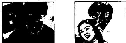
그림 1 실험영상

본 논문에서 사용되는 실험영상은 그림1처럼 자연스런 표정의 얼굴영상을 전제로 배경, 얼굴의 크기, 얼굴의 움직임을 고정하지 않았다.