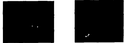
그림 6 입술영역과 회전각