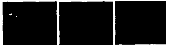
그림 8 반복 실행 결과

⑥ 하나의 얼굴을 검출한 뒤, 다음 얼굴을 검출하기 위해서는 얼굴검출이 성공한 부분을 제외한 영역을 대상으로 알고리즘을 반복한다. 본 실험에서는 ②~④에서 연속적으로 3번까지 비얼굴로 예측되면, 더 이상 검출대상이 없으므로 판단하고 실행을 끝낸다.