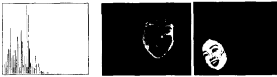
그림 3 적응적 피부칼라영역

② ①의 피부칼라 영역에서 색상정보(H)의 히스토그램을 구한 뒤, 정점을 이루는 색상 값을 선택영역으로 잡고 이웃한 화소들과의 칼라 값의 차가 일정치 이하이면 그 화소를 선택영역에 포함해 영역을 확장시켜 나가는 범람방식(Flood)을 이용하여 1차 얼굴후보를 결정한다. 본 논문에서는 실험을 통해 H=10, S=0.2 V=45 이하인 칼라 값들을 포함시켰다. 이로서 촬영환경에 따라 조금씩 달라지는 피부 칼라 값을 입력영상마다 적응적으로 대응하여 얼굴후보를 결정할 수 있다.