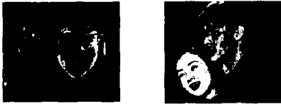
그림 2 대역적 피부칼라영역

① 기존의 얼굴영상처리 논문[7]에서 적용된 피부칼라 값과 본 실험에서 사용된 입력영상(100매)의 피부칼라 값 중 최대치와 최소치의 임계영역( H:0~60, S:0.13~0.68, V:90~255 )을 적용하여 대역적 피부칼라 영역을 결정한다.