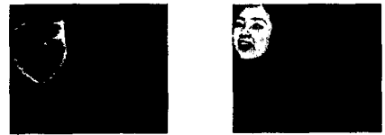
그림 7 기울기가 보정된 얼굴영역

⑥ 하나의 얼굴을 검출한 뒤, 다음 얼굴을 검출하기 위해서는 얼굴검출이 성공한 부분을 제외한 영역을 대상으로 알고리즘을 반복한다. 본 실험에서는 ②~④에서 연속적으로 3번까지 비얼굴로 예측되면, 더 이상 검출대상이 없으므로 판단하고 실행을 끝낸다.