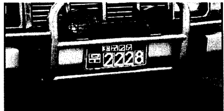
<그림 4> 상단문자 추출결과영상