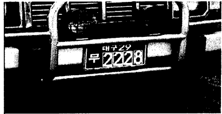
<그림 3> 등록번호 추출결과 영상