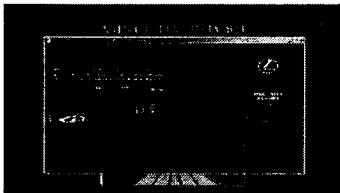
(그림 2)영화 “마이너리티 리포트”사이트 (www.minorityreport.co.kr)

웹사이트 상에서 멀티미디어 콘텐츠를 적극적으로 활용하여 큰 성과를 거둔 브랜드로, 얼마 전 개봉되어 인기를 누린 블록버스터 “마이너리티 리포트”의 유명세를 십분 발휘한 “렉서스”가 있다. 이 사이트를 방문하는 사람들에게 영화의 주인공이 탐 크루즈가 아닌 매혹적인 미래형 자동차 렉서스로 인식될 정도이다. 이 사이트에서 렉서스는 차원 높은 동영상과 VR로 드라마틱하게 소개되며 방문객들은 인터랙티브한 이야기의 전개에 설득 당하여 치밀하게 배치된 렉서스 홈페이지 링크 버튼을 누르게 된다. 성공적인 PPL(Products in Placement)의 사례로 영화와 웹 매체의 통합전략이 가져온 시너지 효과는 브랜드 사이트의 전략에 있어 또 다른 가능성을 제시해준다 하겠다. 이러한 매체의 혼