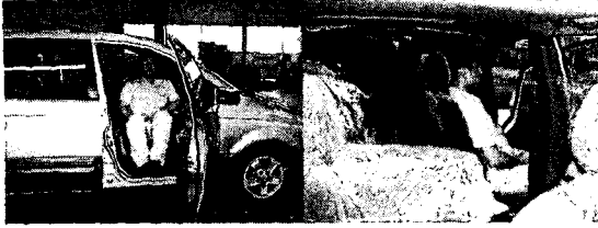
<그림 3> 슬라이드형 시트 탑승 및 작동 모습

사고를 원인별로 보면, 기계의 불안정한 상태와 인간의 불안정한 행동, 또는 두 원인의 결합 등의 세 요인으로 볼 수 있다. 이들 요인중 기계와 인간의 결합요인으로 인한 불안정한 상태가 기계사고의 주요 요인이 되고 있다.