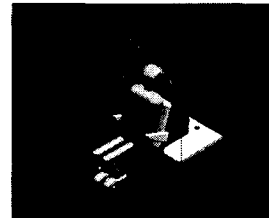
<그림 1> 시뮬레이션 작동 모습