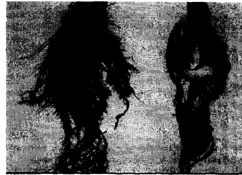
[Fig.2] The photograph of poplar root ( P. maximowiczii ) after exposure on atrazine

현사시의 경우는 노출 36시간이 지나면서 대조군(free-atrazine sample)을 제외한 모든 반응조에서 농도에 따라 다소 차이는 있으나 아래쪽 잎이 처지면서 시들기 시작했다. Atrazine의 농도가 10 mg/L 반응조 현사시는 잎이 황색에서 짙은 암갈색 형태로 변해 나무가 생존해 있지 않은 것으로 보였다. [Fig. 2]에서 보듯이 현사시 뿌리상태를 보면 단적으로 증명된다. 대조군에서의 뿌리는 건강한 상태로 실험기간중에도 지속적으로 성장했던 것을 볼 수 있는 반면, 10mg/L atrazine에 노출된 현사시 뿌리는 썩어들어가고 있음을 볼 수 있다. 양황철과 이태리포플러의 경우도 황백화 현상, 낙엽생성, 뿌리 썩음 등의 현상이 공통적으로 관찰되었다.