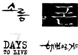
(그림4, 호러물의 타이틀)

호러물의 경우를 살펴보면 다양한 서체를 기반으로 한 디자인 요소의 강한 변형과 왜곡을 보여주며 깊은 상징적 인지성향을 보여준다. "폰"의 경우 일반적인 명조체에 피가 떨어진 듯한 강한 상징적요소를 조합시킨 것과 "소름"의 경우 타이포그래피만으로도 여겨지는 내러티브의 직관성을 공감하게 한다.