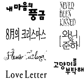
(그림1, 멜로드라마의 타이틀)

장르별로 요약하여 보면, 멜러물의 경우 영화 타이틀 자체에서 서정성을 나타내고 있으며, 그 타이포그래피 또한 감성적인 면이 매우 고려되고 있음을 볼 수 있다.