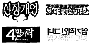
(그림3, 코믹물의 타이틀)

엇보인다. 특정한 내러티브상의 상징적인 에피소드를 시각화 시켜, 멜로물이나 액션의 경우보다 강한 동질적 조응을 이루게 한다. "와이키키브러더스"의 경우, 코믹한 타이포그래피로서 다소 구태의연한듯하게 고루함을 강조한 것과, "신장개업"의 경우 코믹물이지만 기괴한 듯한 스토리텔링의 메타포(Metaphors)를 강하게 부각시킨 것이고, 멜로물이지만 캐릭터의 설정을 코믹스럽게 한 "엽기적인 그녀"의 '엽기적'이란 단어의 강한 역대비를 통해 살펴 볼 수 있다.