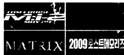
(그림2, 액션물의 타이틀)

이는 영화의 내러티브를 함축, 은유한 직관적인 표현으로서, 정형적인 서체에서 느끼는 심미적인 장점을 서정화 시키거나, 일부 자체(Style) 색상(Color), 장식성(Serif)등을 내러티브로 은유하여 재조합시킴으로서 표출된다. 액션물의 경우는 형태심리학적 지각에 반응하는 그래픽 요소 즉, 날카로운 선(Stroke)이라던가, 강하고 두꺼운(Heave, Bold)지형에서 비롯됨을 강조하는 표현이 유도되기도 한다.