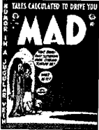
그림1)MAD창간호,1955,11월표지 의글해석 1)

MAD는 William M. Gaines(창립자이자 출판사 설립자)에 의해 1952년 New York의 Broadway에서 10월/11월호 comic로 창간되었으며, 1955년 24호부터 정식 MAD라는 명칭이 사용되면서 magazine(월간지)화 되었다. 1950년대 말까지 MAD는 청소년들 사이에서 두 번째로 인기있는 잡지였었다. 12)