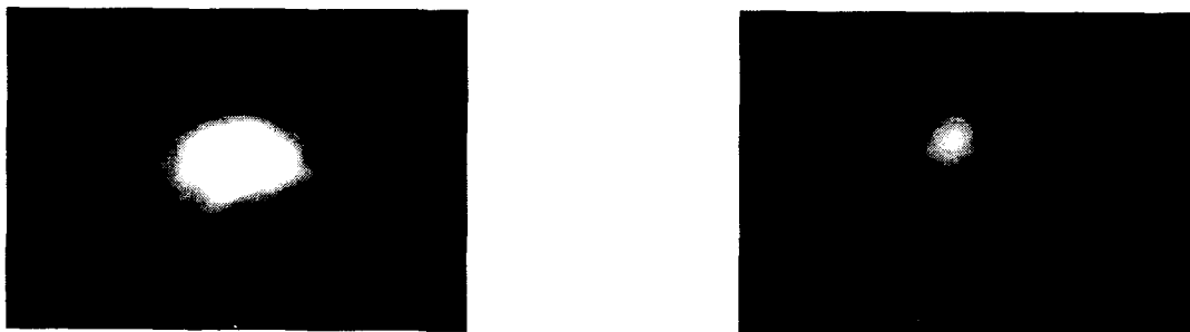
사진 1 전자빔 출력 2 kW에서 전자빔을 focusing 시켰을 때 f=8 ( 좌)의 사진), f=22 (우) 의 Gd 용융면의 사진)