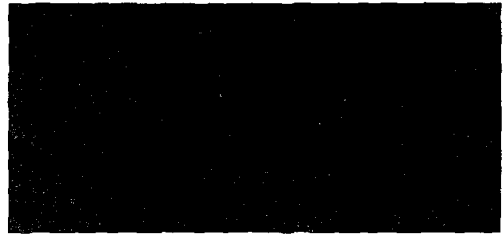
<그림4. COMMIT Check Table>