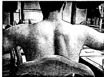
Fig. 1. Photograph showing wasting of the right supraspinatus

본교실에서는 자기 공명 영상 소견상 발견된 결절종을 관절내에서 탐식자를 이용하여 위치를 확인 후 주변부를 눌러 튀어나오게 한 다음 주변이 확실히 결정되면 shaver를 이용하여 제거하였다.