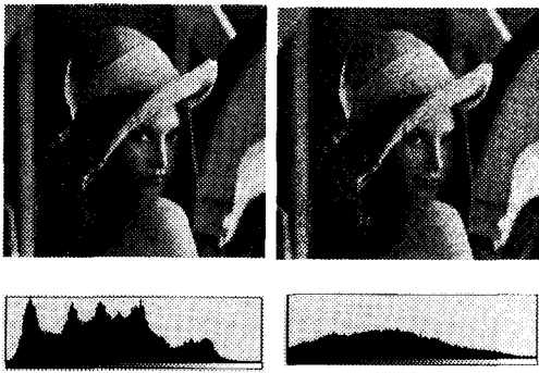
그림 2. 원영상과 히스토그램 그림3. 미디안필터 잡음영상

표 1에 각각의 방법에 대한 원영상과의 그레이 레벨값의 비교를 나타낸다. 표 1에서 각 영상에 대한 전체 픽셀의 그레이값들의 평균과 중간값은 제안된 방법을 적용한 영상의 경우 원영상과 상당히 유사함을 알 수 있다. 그러나 average 필터와 lowpass 필터의 경우 제안된 방법에 비해 값의 차이가 크다. 이것은 average 필터와 low-pass 필터의 경우 히스토그램의 형태는 원영상과 유사하게 복구하나, 전체 그레이 레벨값을 변화시켜 원영상의 정보가 손실됨을 나타낸다. 또한 영상의 명암 대비 정도를 나타내는 표준편차 값도 제안된 방법이 원영상과 상당히 유사함을 알 수 있다. 이러한 결과는 제안한 오토마타 방법이 잡음제거에 매우 유효하고 효율적임을 시사하고 있다.