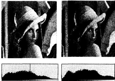
그림6. median filter 방법 그림7. lowpass filter 방법