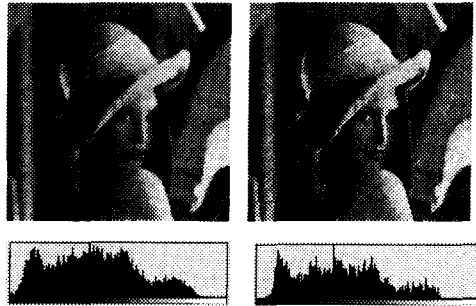
그림5. Parallel방법 (4방향이웃, 8방향이웃)