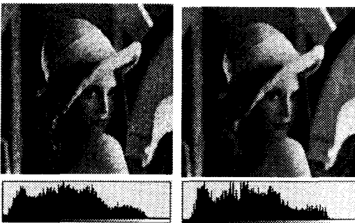
그림4. Sequential방법(4방향이웃, 8방향이웃)