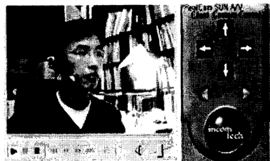
(b) Client 화면