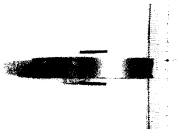
그림 1. 자기 부상 현상과 자기 부양효과

본 연구에서 제작한 \text{BiPbSrCaCuO} 계 초전도시료에서는 그림 1에서 제시하는 Suspension 효과가 관측되었다.