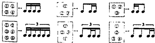
[그림 4] 정간내에서 율명 읽는 순서

정간보를 읽는 순서는 위에서 아래로, 오른쪽 줄에서 왼쪽 줄로 읽어나간다. 다만 정간 속의 율명은 왼쪽에서 오른쪽으로 읽은 다음 위에서 아래로 읽는다.