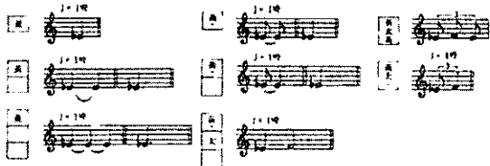
[그림 3] 정간보에서의 박자

정간보에서 한 정간(칸)은 한 박이다. 정간보의 한 정간이 한 박일 때, 그보다 긴 음은 정간의 수에 따라, 그보다 짧은 음은 정간속에 쓰여진 율명의 위치에 따라 길이가 결정된다