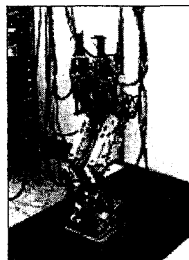
Pic 1. 정면도

본 논문에서는 Pic. 1, 2와 같이 각각의 다리는 3개의 Pitch 관절과 발목 부에 1개의 Roll 관절을 가진 8자유도이며, 보행 시 균형을 유지하기 위한 Pitch, Roll 관절 1개씩의 2자유도를 갖는 총 10자유도 이족 보행로봇을 제작하였다. 이족 로봇은 발이 지 면과의 접촉상태에 따라 동역학적 해석이 달라지는데, 본 논문에 서는 보행 동작 중 한쪽지지 상태의 동역학 해석을 수행하였다. 또한 총 10자유도 중에서 전방보행의 동역학을 해석하므로 균형 관절을 포함한 7자유도 운동을 살펴본다. 운동방정식을 고찰하기 위하여 지지부 한쪽다리를 모델로 한다면, 다리는 기본적으로 인 간과 같이 발목, 무릎 및 힙과 같은 측면에 놓인 다리의 발바닥 에 기저 좌표계를 설정하였다. 제안된 시스템의 동역학 방정식을 유도하기 위하여 우선, 회전관절 공간에서의 동역학식을 유도한 후, 4절 링크기구의 운동방정식을 유도하여 궁극적으로 볼 나사 좌표 계에서의 방정식으로 표현하였다.