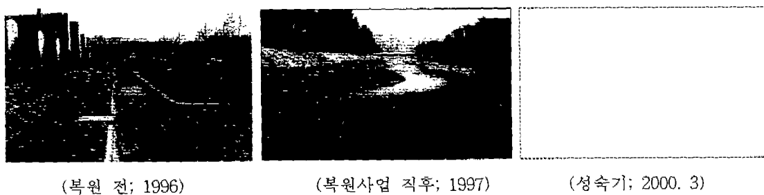
그림 1. 양재천 파천 구간의 하천 복원(환경부/건기연, 1997~1999)

국내에서는 1980년대 말부터 하천 기술자들 사이에 하천 환경의 보전과 개선의 필요성에 대한 공감대가 서서히 형성되기 시작하였다. 이러한 변화는 그 당시 경제 개발의 진전과 국민 생활의 향상에 따라 이제는 주변을 돌아볼 필요가 있다는 환경 보전에 대한 사회적 분위기에 의한 것이다. 특히 토목 재료를 이용하여 하천을 획일적으로 인공화 하는 치수 사업에 대해 가능한 생물 재료를 이용하여 하천을 자연에 가깝게 정비하는 이른바 자연형 하천공법의 도입에 대한 공감대가 형성되기 시작하였다. 이에 따라 1990년대 들어 자연형 하천 계획과 공법에 대한 연구가 본격적으로 시작되고(건교부/건기연, 1991~1996), 양재천, 오산천 등 일부 하천에 실제 적용되었다. 1990년대 중반에는 하천 복원 측면에서 생태, 조경 전문가들에 의해 자연 상태에 가까운 하천 구간을 대상으로 하천 생태계 구조와 기능에 대한 지속적인 연구도 병행되었다(환경부/건기연, 1997~1999).