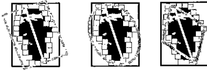
그림 2. 이상타원의 종류

식(6)은 일반적인 칼만필터의 수식이며, m_k 는 시점 k에서의 측정벡터를 나타내며, 행렬 H는 시스템 벡터인 s_k 와 측정 벡터를 연결하는 관측 행렬(observation matrix)을 나타낸다. 행렬 F는 상태전이 행렬(state transition matrix)로서 한 상태와 다음 상태간의 관계를 정의한다.