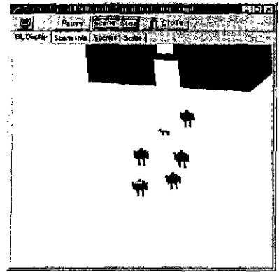
그림 2 장면 실행

시뮬레이터에서는 저작단계에서 정의한 이벤트를 보여주는 기능과 이벤트를 추가, 삭제, 변경하는 기능을 제공하므로 새로운 상황으로 전개할 수 있다