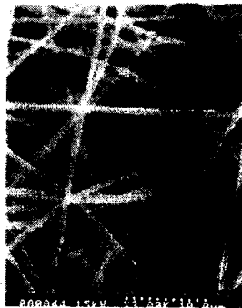
Fig. 1. SEM image of membrane surface

얻어진 막의 두께는 ~40 \mu\text{m} 이고 전자현미경으로 살펴본 막의 구조는 그림 1과 같다. 얻어진 막의 평균 섬유 굵기는 400 나노미터이다.