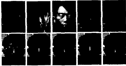
그림 2. 실험에 사용된 SKKU DB의 한 예 은 혼성 10인에 대하여 각 10개의 256 gray value 영상으로 구성되어 있다. 각기 다른 표정과 조명의 방향에 따른 변화 그리고 안경 착용등과 같은 얼굴인식에 방해 요소로 작용하는 조건들을 고려한 영상들로 이루어져 있다. 본 논문은 위의 SKKU database와 YALE database내의 각 100개씩 총 200개의 영상들에 대하여 Leaving-One-Out방법을 적용하여 미리 계산된 훈련 영상의 패턴 벡터들과 실제 입력 영상을 선형 변환하여 얻은 패턴 벡터간의 최소 자승 에러 거리를 갖는 클래스를 선택하도록 하는 Nearest neighbor 분류법을 사용하였다.